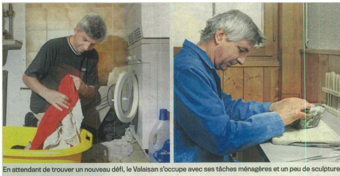
En attendant de trouver un nouveau défi, le Valaisan s'occupe avec ses tâches ménagères et un peu de sculpture.